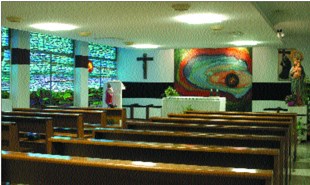
La Cappella del nuovo edificio così come appare oggi.

La Cappella, allora come oggi, posta al centro della casa, diventava il nostro rifugio sicuro per ritrovare noi stesse, incontrare il Signore e portare a Lui quel-