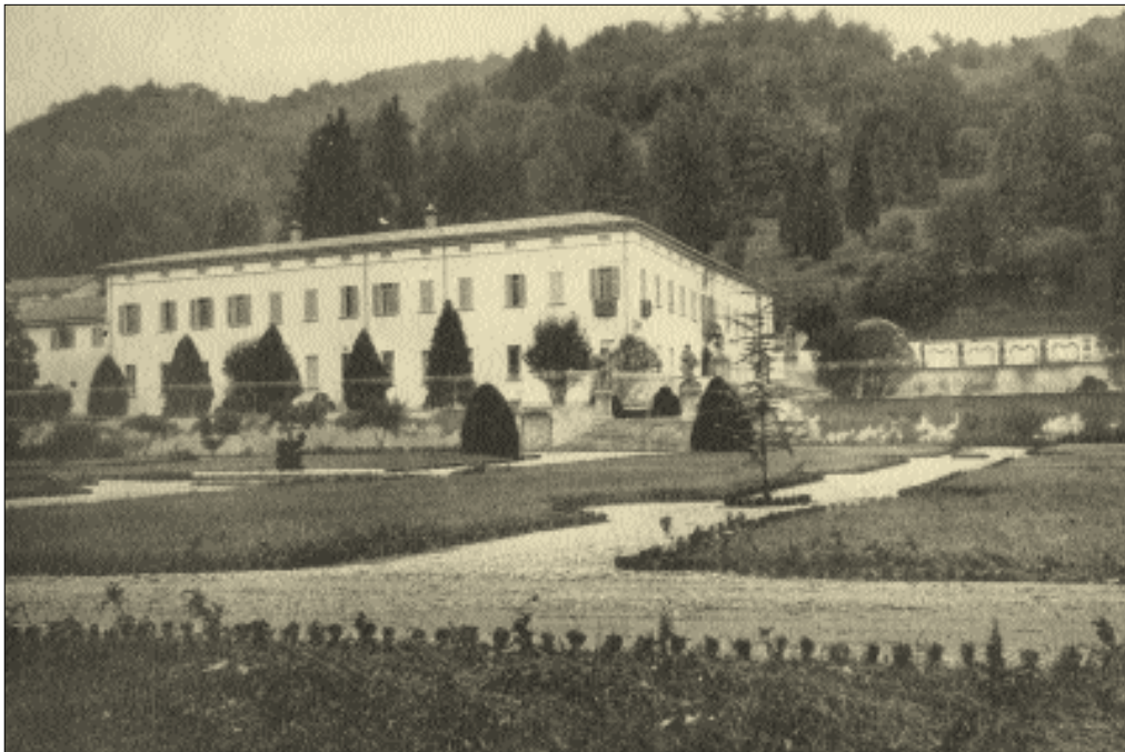
Una veduta d'insieme del parco con la Villa Bassi-Roncaldier.