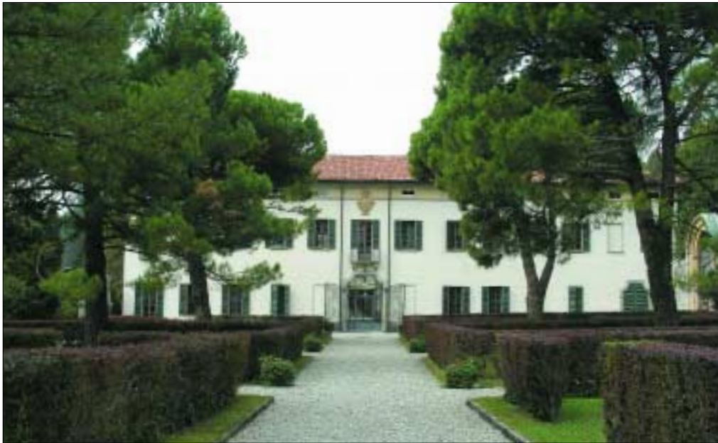
Veduta attuale dal parco della Villa Bassi-Roncaldier.

Nel corso del mio mandato sono stati attivati gli Ambulatori specialistici convenzionati di psichiatria e neurologia, sempre con l'avallo della sanità pubblica, quindi, in modo da dare continuità agli interventi operati e messi in atto nel corso delle degenze. Infine, è stato attivato un Centro Diurno e l'Assistenza Domiciliare. Come vede, cerchiamo di rispondere nelle nostre possibilità alla