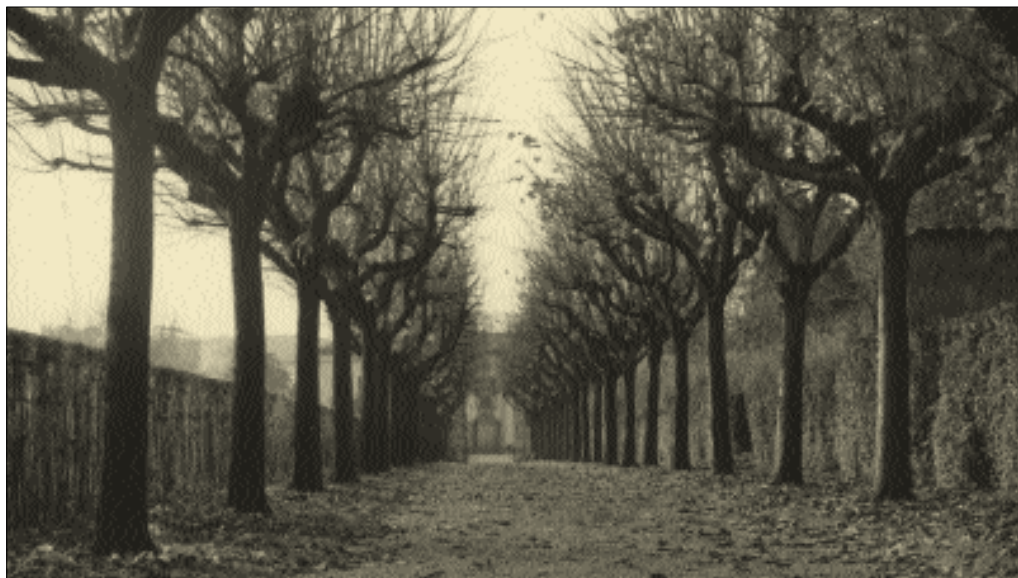
Una veduta della Villa Bassi-Roncaldier dal Viale dei tigli prima della nuova costruzione dell'attuale Casa di Cura.

Non so se solo qualche giorno o qualche mese dopo, ma indubbiamente ancor prima di accorgermi che appena oltre il giardino c'era un orto di cui si decantavano le patate tanto buone, ne ho visto lo sbancamento per la nuova costruzione.