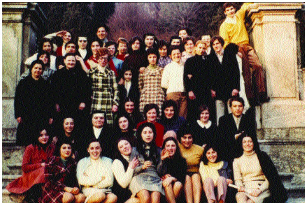
Un sorriso in un gruppo di pazienti degli anni Settanta.