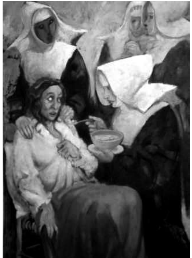
Le prime Suore Ospitaliere del Sacro Cuore di Gesù assistono una malata (dipinto del Bramante)

"Non vi è che una cosa che valga e meriti stima: ed è quella di servire e amare Gesù lavorando sempre e soffrendo per amor suo. Questa è la vera felicità alla quale dobbiamo aspirare". ■